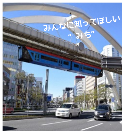
みんなに知ってほしい "みち"