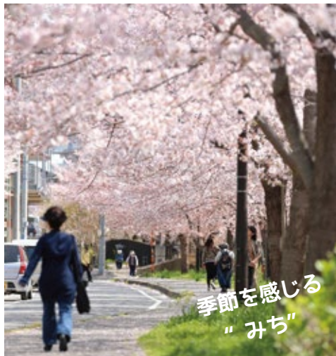
季節を感じる "みち"