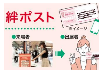
会場およびオンラインで作品を見た人からメッセージが届きます。